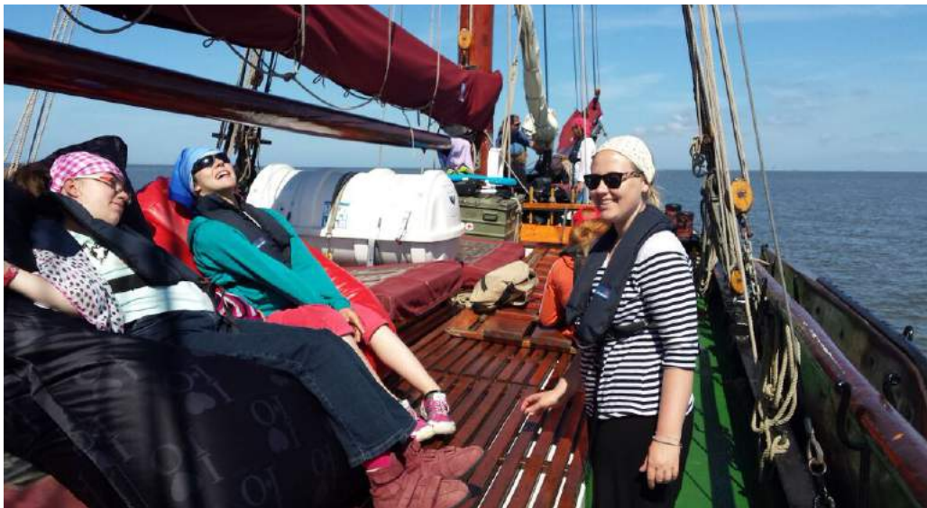
Kein Wind – Zeit zum Chillen oder zum Üben?

Außerdem bieten wir TrainerkandidatInnen im Zertifizierungsprozess die Gelegenheit sich einzubringen, das Seminar mitzugestalten und ein differenziertes Feedback zu erhalten.