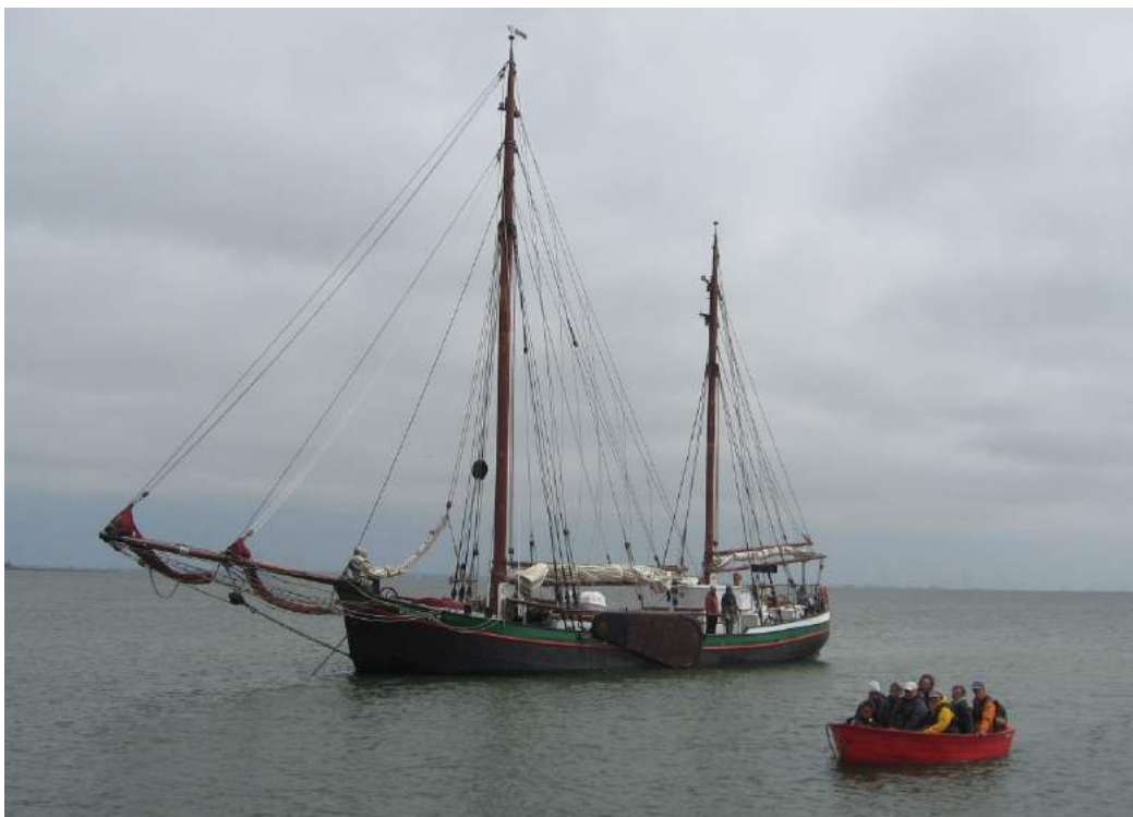
Auf der Fahrt zur Hallig „Gröde“